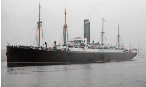
El barco, que se llamaba La Bretagne, tenía la capacidad de llevar casi 1.000 pasajeros.