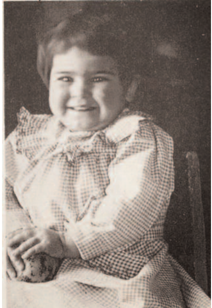
Frida Kahlo a los dos años